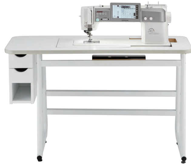
Table Stand voor CM7P 494-718-001 Inlegplaat for CM7P 494-410-103