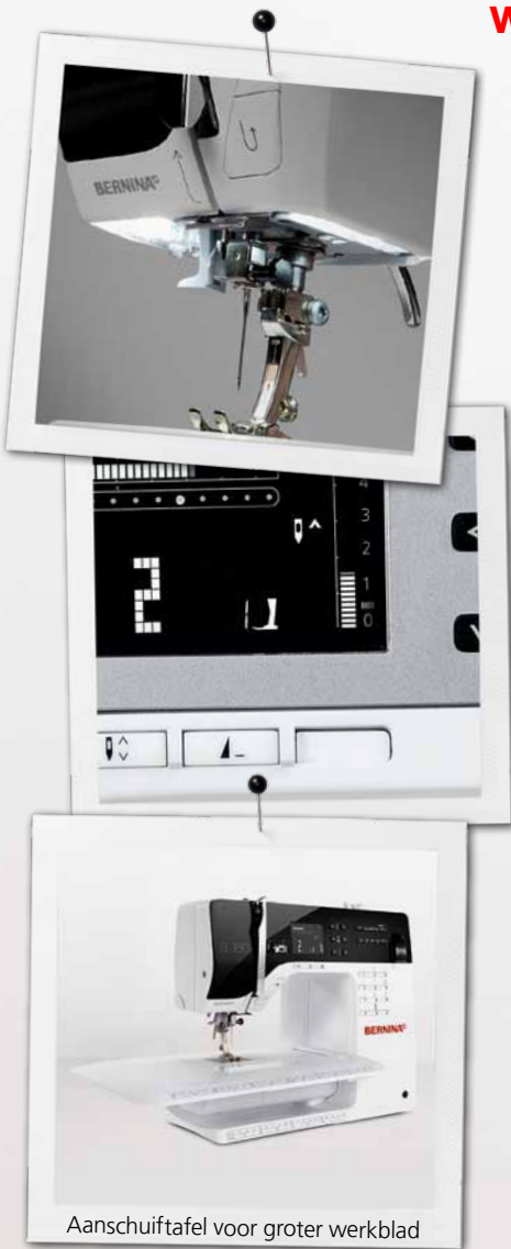
Aanschuiftafel voor groter werkblad

Lees meer over de BERNINA 3-serie en download gratis de werkbeschrijving van de party outfit: www.bernina.com/3series .