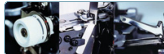
Boven en ondergriper

Met een draai aan de knop verstelt u de zoombreedte precies zoals u wilt.