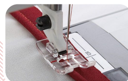
TRANSPARANTE PASSEPOILVOET Voor het innaaien van een passepoil in naden of randen voor een perfecte afwerking