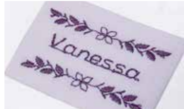
Spiegel, combineer steken en sla ze op en geef uw ontwerp uw eigen accenten. Tot 4 lettertypes. U kunt uit verschillende stijlen kiezen.

Zie de lijst met functies voor specifieke functies per model.