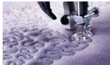
Geef uw verbeelding de vrije loop. De open naaivoet voor quilten uit de vrije hand wordt met de quilt ambition™2.0 naaimachine meegeleverd.