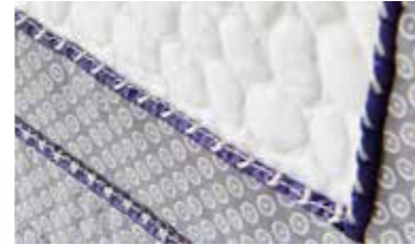
Geef uw quilt een interessante dimensie met passepoildetails die zijn geaccentueerd met decoratieve steken.

Het PFAFF® merk heeft een groot assortiment extra naaivoeten, inclusief een groot aantal dat speciaal is ontworpen voor het originele IDT™ systeem. Kijk op www.pfaff.com voor het volledige assortiment accessoires.